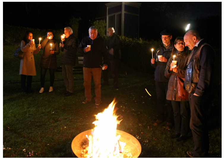
Zusammensein am Osterfeuer.