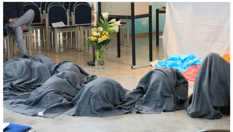
Die Küken schlüpfen schon bald...