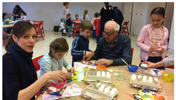
Die Kinder hatten die Eier in der Woche vor Ostern gefärbt.