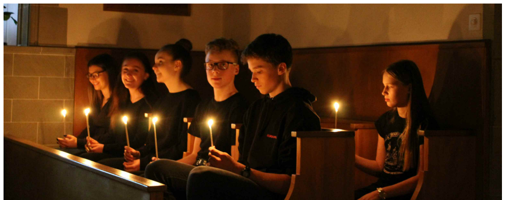
An der Osternachtfeier wirkten die Konfirmandinnen und Konfirmanden mit.