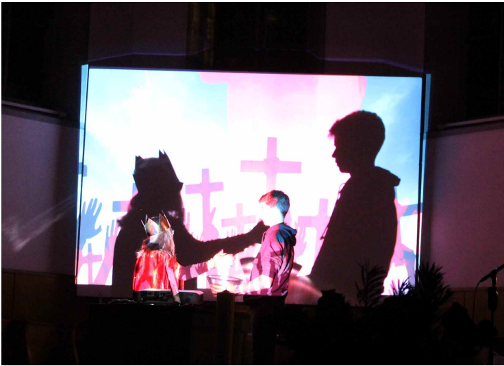
Eindrückliche Szene: Pilatus wäscht seine Hände.