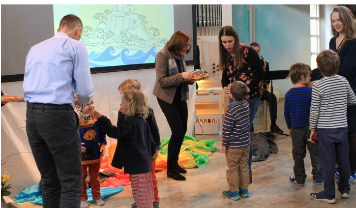
Abendmahl für Gross und Klein.