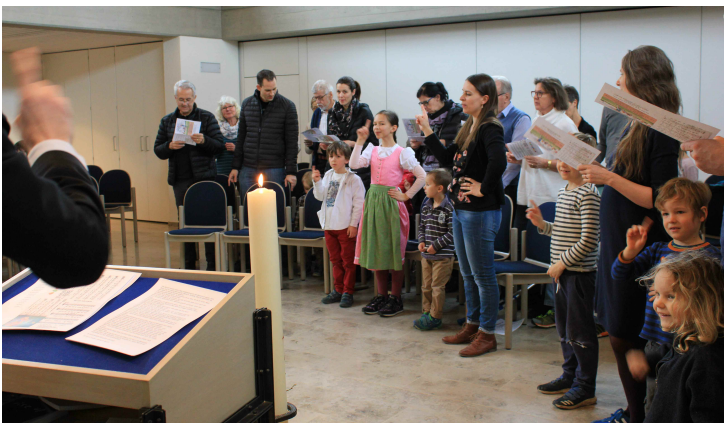
Fröhliche Lieder am Ostergottesdienst.