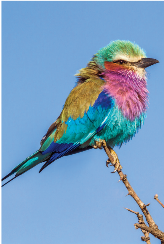
reformierte kirche stallikon wettswil